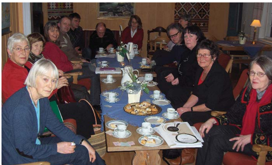
Sarpsborg Mållag ordna det praktiske før fylkesårsmøtet 2009 på Matstova.