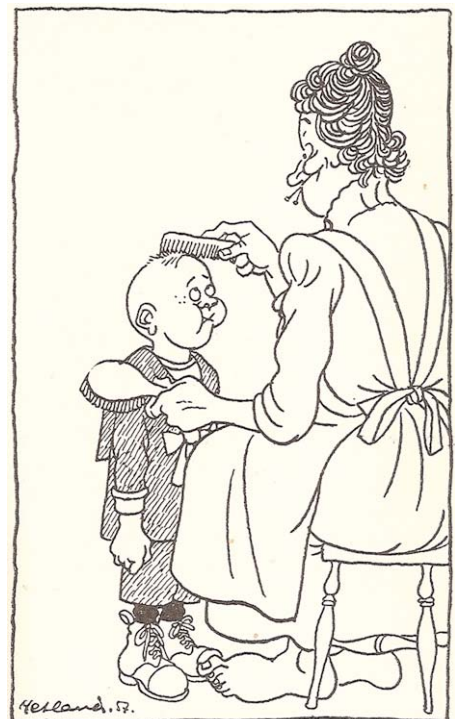
- Jæ er så ille fornøyd med atter'e jæ døpte dæ for Brynild, gutten min! (Teikning Audun Hetland, Glade Østfoldhistorier 1957)